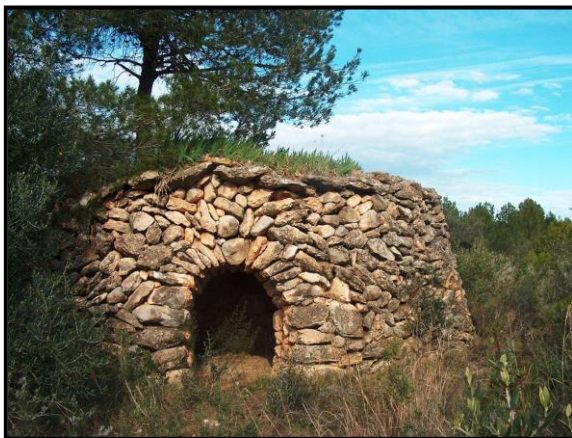
Barraca dels lliris

Aleshores, des de la Direcció General de Cultura Popular i Associacionisme Cultural, es