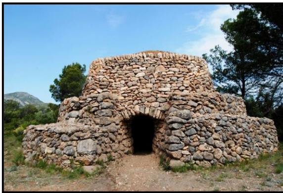
Barraca del Jaume de la Cota

Tot va començar quan el 19 d'abril de 2016 la Generalitat va prendre l'acord que cinc barraques de Mont-roig fossin declarades " Bé cultural d'interès nacional " (BCIN), en la categoria de Zona d'Interès Etnològic. Des d'aleshores, aquestes barraques són les úniques construccions d'aquesta mena que tenen aquesta qualificació al Principat. Resolució: 21-11-2014, Acord govern: 19-4-2016 i Publicació al DOGC: 21-4-2016.