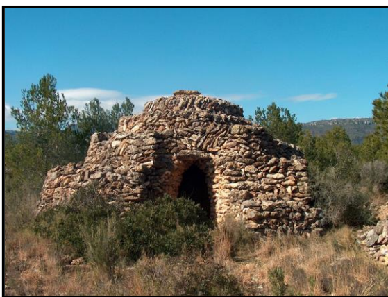
Barraca de l’Espiral

El conjunt de barraques del terme municipal de Mont-roig van ser, en una primera fase, incloses en el “Catàleg de béns protegits” (“B.26”) del POUM (Pla d’Ordenació