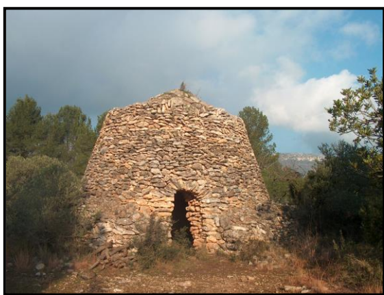
Barraca dels Comuns del Pellicer